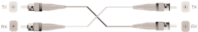
Figure 3-1. Rear View and Fiber Connections.