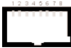
Figure 4-1. LMX Sub-Channel Connector.

Use the tables below for proper connection from sub-channels to the DTE equipment.