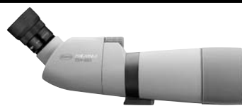
TSN-663 PROMINAR XD Lens, Angled TSN-663 プロミナー XDレンズ 傾斜型