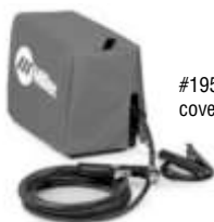
#195 144 cover shown

Para uso pesado, impermeable, y resistente al moho. Protege y mantiene el acabado de su maquina.