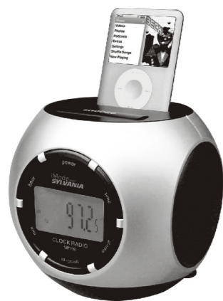
CLOCK RADIO SIP198