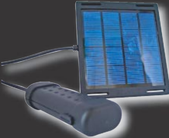
Silva Solar I