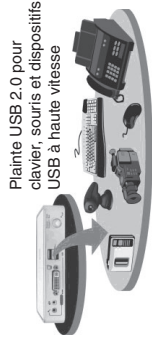
Plainte USB 2.0 pour clavier, souris et dispositifs USB à haute vitesse

Les deux ports USB sur le panneau avant sont en général utilisés pour les connexions de clavier et de souris. Il existe toutefois des ports USB 2.0 qui peuvent aussi être connectés aux dispositifs USB pour que vous puissiez partager et partager ces dispositifs USB entre deux ordinateurs.