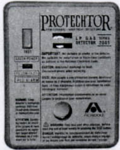
Surface Mount [S]

Model No. GS-961-LP-RV Part No. 37761 Model No. GS-961-LP-RV Part No. 37762 Retail Flange Part No. 37765