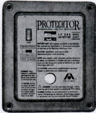
Flush Mounting [F]