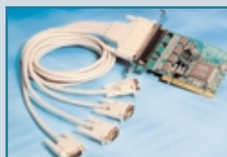
Connecteur 4 x 9 broches : UC-268