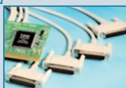
Connecteur 4 x 25 broches : UC-265

Brainboxes propose une solution pour chaque niche du marché des 4 ports : Pour l'option bas profil, voir : UC-260, UC-271 Pour le connecteur alternatif : UC-701 & UC-746 Pour le connecteur STREAMLINE , voir : UC-420 & UC-836