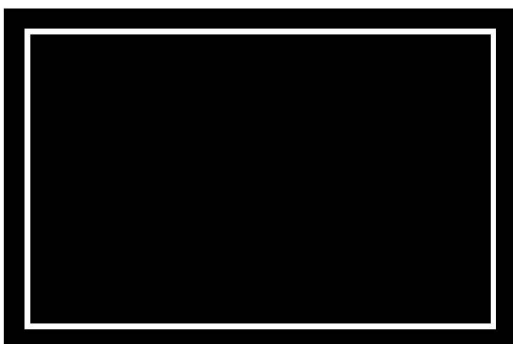
Flatscreen Display (Fixed Output)

P 3 for connecting to devices with high signal voltage e.g. CD players or flatscreen displays with fixed output.