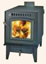
Baron 2000 SP