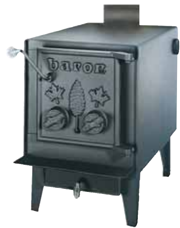
Baron 1880 SP

Tiroir à cendres facile d'accès Easy-to-access ash drawer Chauffe jusqu'à 1,800 pieds carrés Heats up to 1.800 sq. ft. Capacité de 65,000 BTU Heating capacity : up to 65.000 BTU Longueur des bûches jusqu'à 26" Log length up to 26" Enveloppe avec ventilateur optionnelle Optional envelope with blower