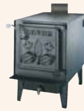
Baron 1880 SP