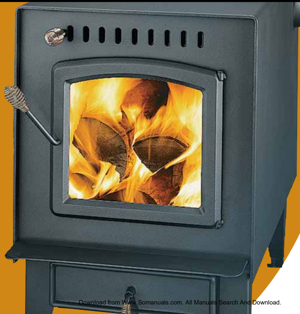
Baron 2000 SP