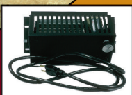
Ventilateur / Blower