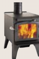
EASTWOOD 1900 DB03170