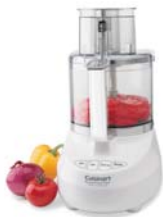
Food Processors Robots de cuisine