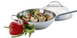
Cookware Batterie de cuisine