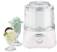
Ice Cream Makers Sorbetières

Cuisinart offers an extensive assortment of top quality products to make life in the kitchen easier than ever. Try some of our other countertop appliances and cookware, and Savor the Good Life®.