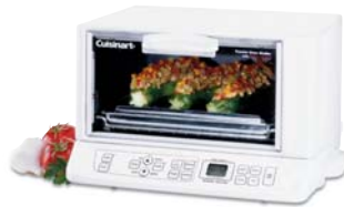
Toaster Ovens Fours grilloirs